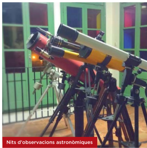
Nits d'observacions astronòmiques

Ho organitza: Associació d'Amics de l'Astronomia TRI-A Rubí