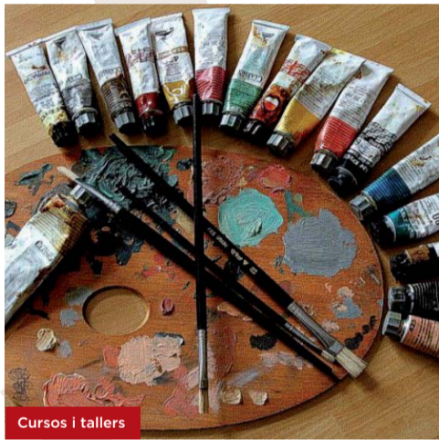
Cursos i tallers

Dimarts de 10 a 11.30 h Del 30 d'octubre al 18 de desembre Amb Ivana Navarro 8 sessions (12 h) | Preu: 30 €