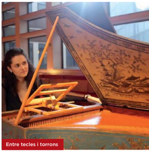
Entre teclès i torròns