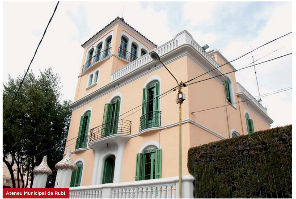
Ateneu Municipal de Rubí

L'Ateneu també és conegut amb el nom de Torre Riba o Torre Ezpeleta. Fou construït l'any 1912 i es tracta d'un dels edificis més representatius del modernisme rubinenc; és un emblema del patrimoni arquitectònic de la ciutat, i va ser adquirit l'any 1983 per l'Ajuntament de Rubí amb el compromís que es conservés com a espai cultural.