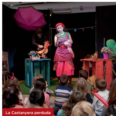
La Castanyera perduda

Cadascun dels espectacles requereix inscripció prèvia. Places limitades. Hi col·labora: LabCreatiu.