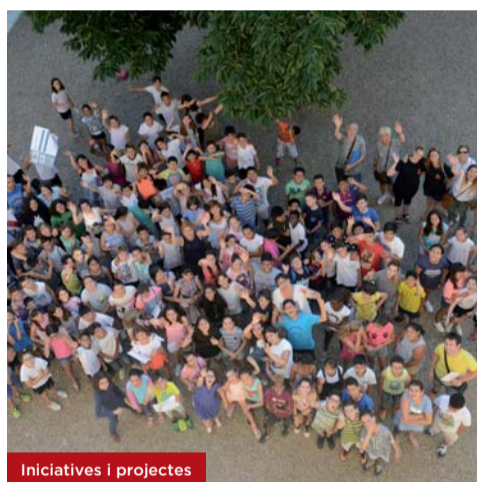
Iniciatives i projectes

Ho organitza: Associació de Solidaritat i Ajuda Veïnal (ASAV)