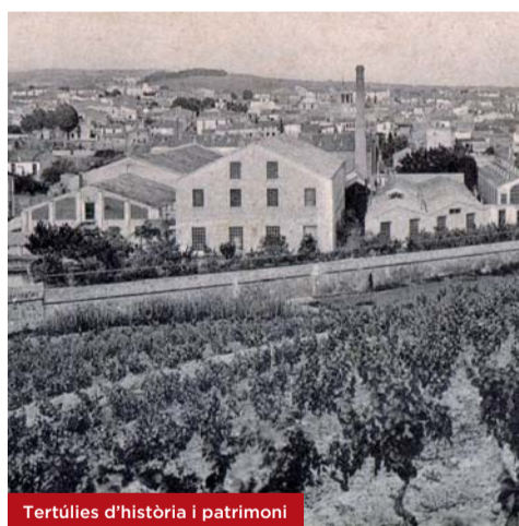
Tertúlies d'història i patrimoni

Divendres 28 de setembre a les 19 h A càrrec de Pere Bel, estudiós local.