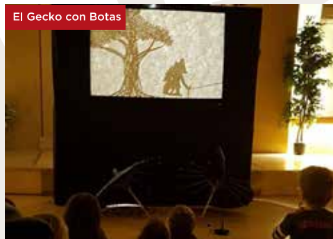
El Gecko con Botas