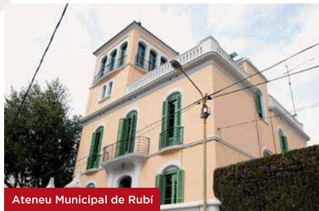
Ateneu Municipal de Rubí

de Rubí, així com ser un espai de referència per al teixit associatiu de la ciutat.