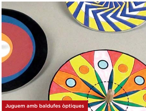
Juguem amb baldufes òptiques