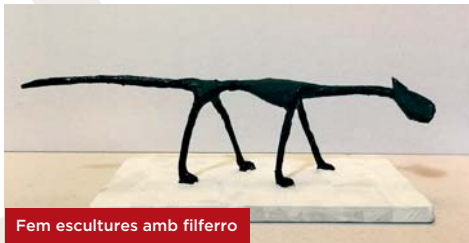
Fem escultures amb filferro