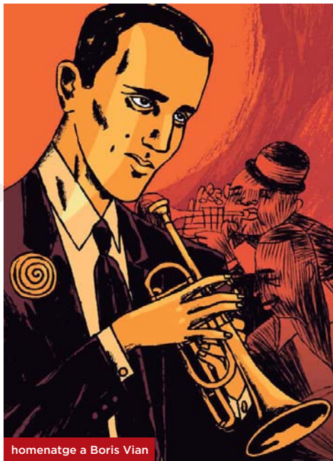
homenatge a Boris Vian

Tan important pel que va representar com pel que va crear, Vian —poeta, dramaturg, novel·lista, cantautor i especialista en jazz—, a través de la seva ironia i alhora del seu tarannà provocador respecte a les institucions franceses i la societat benestant en general, va ser tot un referent. Fins i tot per a nosaltres: ben conegut en narrativa, però molt poc en poesia, i pràcticament inexistent en català. Per això el volem mostrar, amb VIAN (manual de supervivència), pràcticament com a primícia.