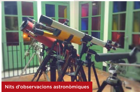
Nits d'observacions astronòmiques

Tardes: de dilluns a divendres, de 16 a 20.30 h