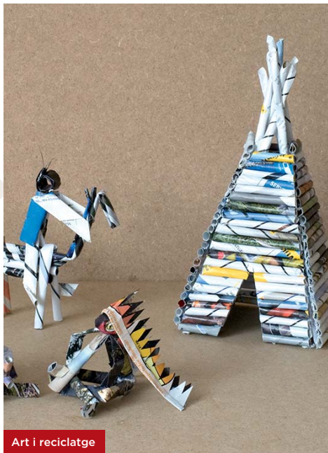
Art i reciclatge

Activitat recomanada per a famílies amb infants de 9 a 12 anys