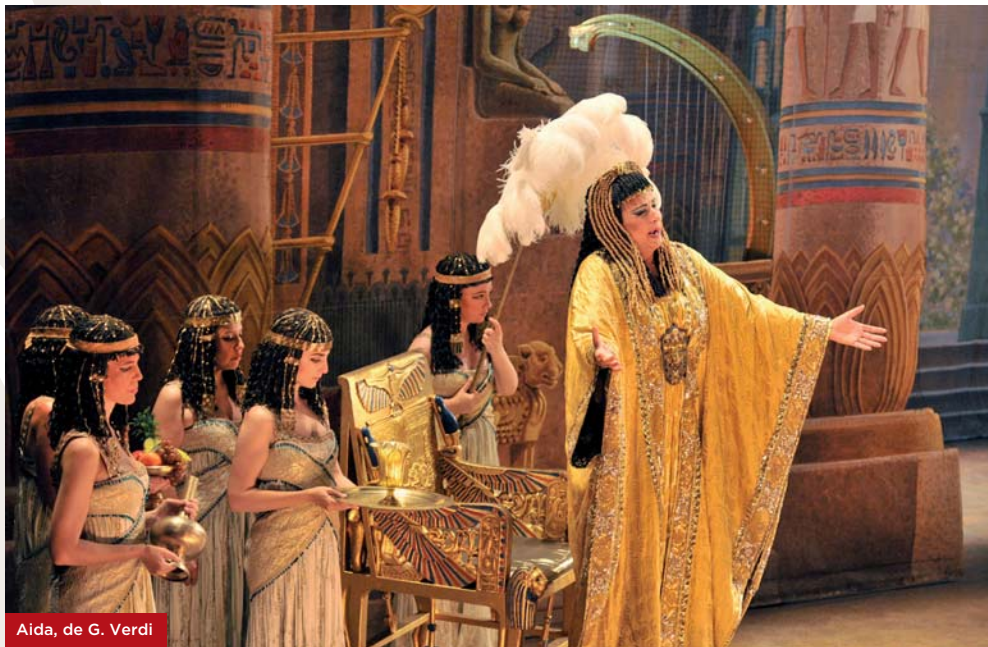
Aida, de G. Verdi