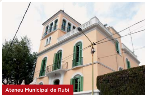
Ateneu Municipal de Rubí

de Rubí, així com ser un espai de referència per al teixit associatiu de la ciutat.