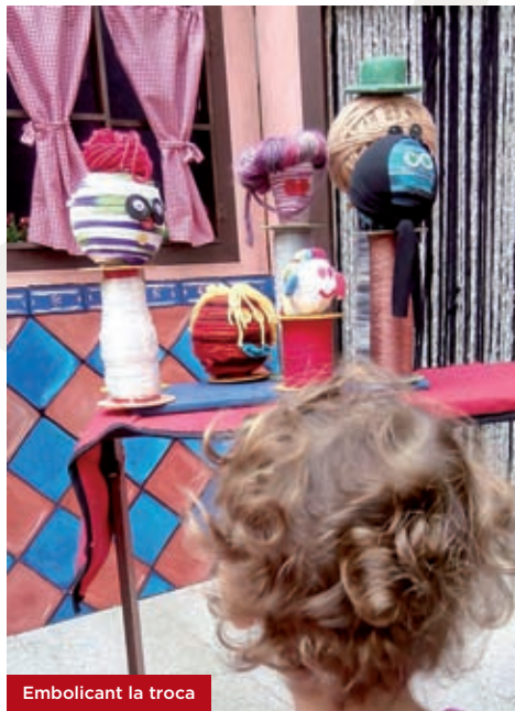
Embolicant la troca

La Quimeta és una costurera molt simpàtica. Avui està molt enfeïnada, tots els animals fan una festa elegant i la Quimeta els ha d'ajudar a guarnir-se. Mentre la Quimeta cus, comentarà als nens la importància del vestit en la història de la humanitat i els explicarà el conte d'El vestit nou de l'emperador. Una obra de titelles, música i cançons per entretenir grans i petits. Adreçat a nens i nenes majors de 3 anys. Hi col·labora: La Xarxa