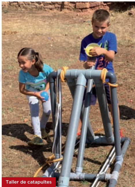
Taller de catapultes

Construirem diferents catapultes i analitzarem com funcionen. Experimentarem amb el pes dels projectils i aplicarem aquest mètode experimental per acabar veient com influeix el seu pes en el seu abast.