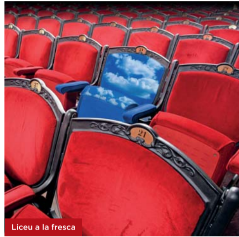
Liceu a la fresca

Dissabte 16 de juny a les 22 h Entrada lliure. Aforament limitat