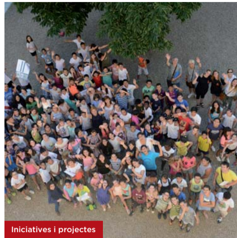
Iniciatives i projectes

Troba més informació a ateneurubi.cat/projectes