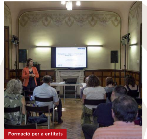
Formació per a entitats

24 i 26 d'abril de 19 a 21 h Període d'inscripcions: del 9 al 20 d'abril